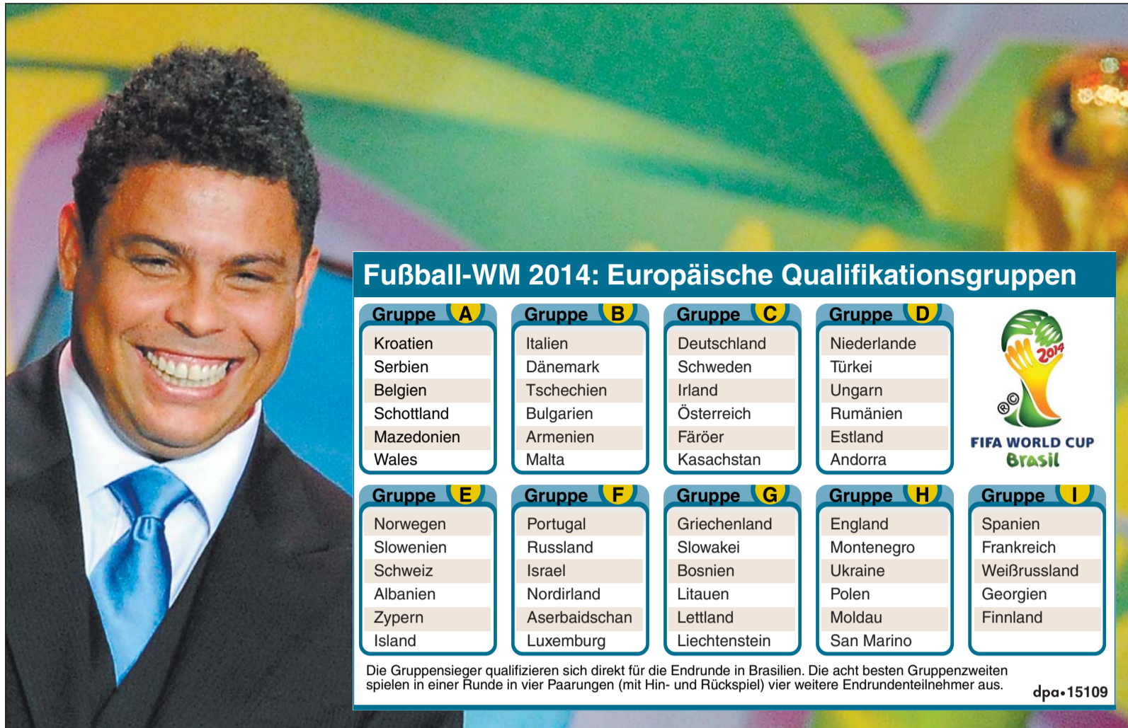
Die brasilianische Glücksfee Ronaldo ist äußerst zufrieden mit seinem Werk – und die DFB-Auswahl darf es auch sein.