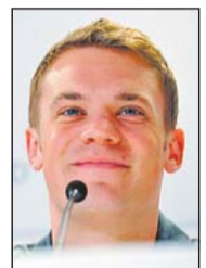
Nationaltorwart Manuel Neuer.

Ein wenig Balsam auf die WM-Wunden dürfte die Auszeichnung für Bajramaj sein. Sie sollte das Gesicht des Titelkampfs im eigenen Land werden, sie führte dann aber meist ein Bank-Dasein.